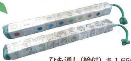
ひも通し(絵付) 各 1,650円 [ふきのとう]