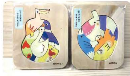
いちょうのマグネットパズル 各 1,200円 [木馬工房]