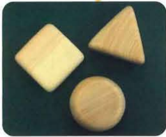
ちょー気持ちいい 1個 330円 3個セット 990円 [ふきのとう]