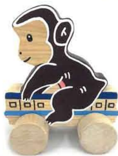
さる電車 1,500円 [ひのき工房]