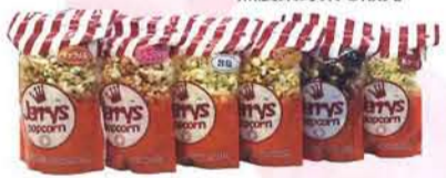
↑ジェリーズポップコーン。1個 380円。味は現在6種類あります。

取材した日はクリスマスパーティ！手づくりのケーキを食べたり、サンタさんからプレゼントをもらったりと、みなさん笑顔で楽しいひとときを過ごしていました。