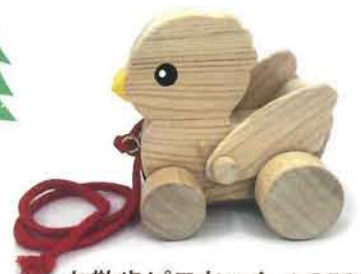
お散歩ピヨちゃん 1,650円 [ひのき工房]