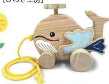
お散歩シリーズ 1,650円 [ひのき工房]