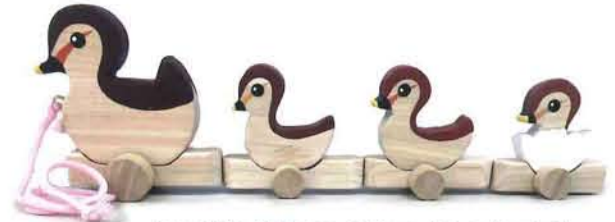
かるがも親子 2,400円 [ひのき工房]