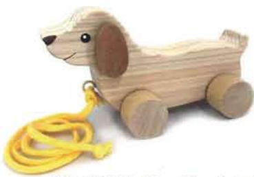
車つきおもちゃダックス(大) 1,450円 [ひのき工房]