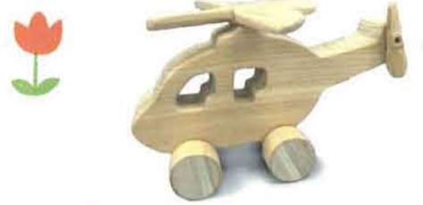
車つきおもちゃヘリコプター(大) 1,550円 [ひのき工房]