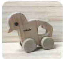
椛の押し車 各 500円 [木馬工房]