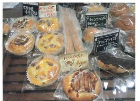
「誰でも安心して食べられるよう、体に悪いものは使わない」という信念を持ってつくっています。