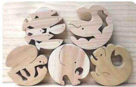
海のくるくる陸のごろごろ 各 300円 [木馬工房]