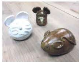
↑各 300円 [恩方育成園]