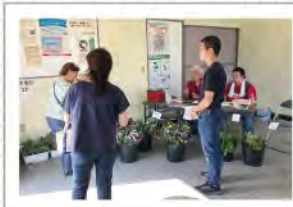
↑霊園での香華販売 公園の清掃活動→