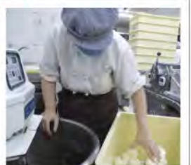
おいしい生地が出来上がりました!