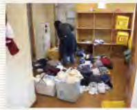
(社福)多摩養育園にて