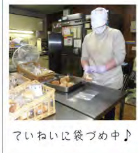
ていねいに袋づめ中♪

国産小麦、よつ葉バター、ホシノ天然酵母を使用しています。モチモチした食感で、トースターで温めると焼き立ての風味が味わえます。