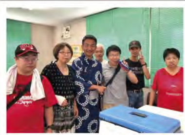
↑市の市民活動支援センターまつりに参加