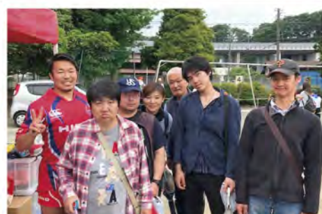
↑市の新選組まつりにて